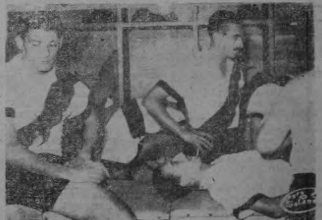
En el camerin del Danubio después del primer tiempo cuando el masajista está en acción