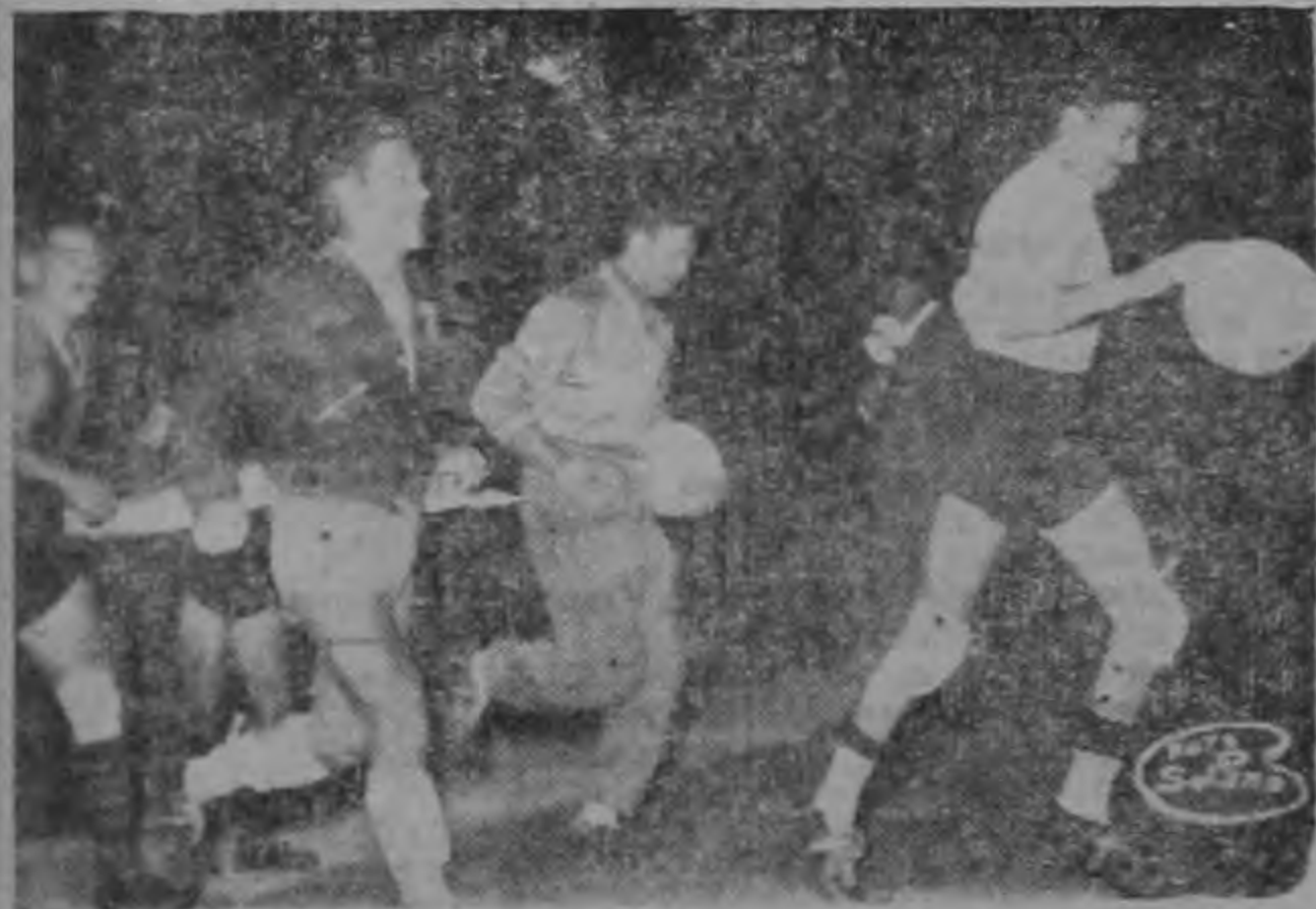
Los jugadores del Alajuelense ingresan a la cancha

De Ud. atentamente, Beltrán Meza, Evangelista Chavarría P., Cronometrista.