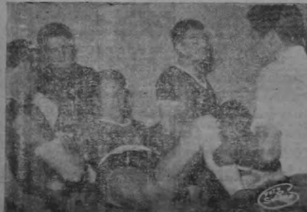
Una visita al camerin del Alajuelense después de la terminación del partido.