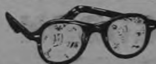
VEA MAS POR MENOS DINERO

PENSION IBERICA, instalada en el Barrio de la California, sobre Avenida Central, frente Botica Primavera. Habitaciones bien amuebladas, agua caliente en los baños. Tenemos servicio de comida a la carta. Sábado y Domingo platos españoles. Cuaiquier día servimos comidas especiales. Tenemos servicio de cantina con licores extranjeros. Atención y moralidad. Especial para estudiantes universitarios por quedar cerca de la Universidad. Laureano Gago.