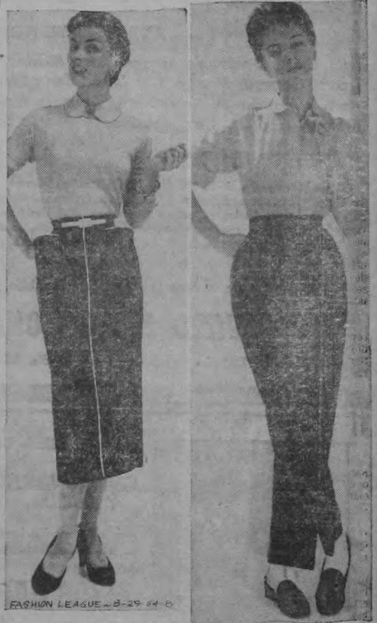
FASHION LEAGUE 8-29-54 B

Traje de dos piezas: la blusa es de franela, un material que siempre es popular.